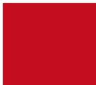
Pantone 1805 C C 20 M 100 Y 100 K 0