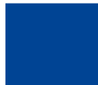
Pantone Reflex Blue C 100 M 80 Y 0 K 0

Na črno belih podlagah uporabljamo črno beli logotip v pozitivu do vsebnosti 49 % črne v podlagi.